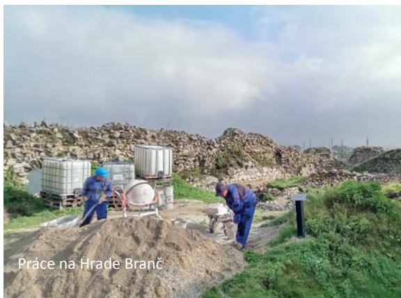
Práce na Hrade Branč