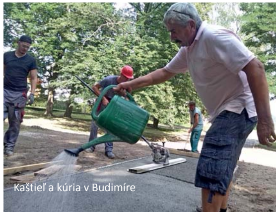
Kaštieľ a kúria v Budimíre