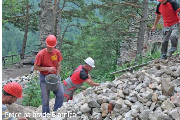
Práce na hrade Blatnica

Na podporu realizácie spoločných projektov na obnovu kultúrneho dedičstva bola podpísaná „ Dohoda o vzájomnej spolupráci medzi Ministerstvom kultúry Slovenskej republiky (ďalej MK SR) a Ministerstvom práce, sociálnych vecí a rodiny Slovenskej republiky (ďalej MPSVR SR)“ a Ústredím práce, sociálnych vecí a rodiny (ďalej Ústredie PSVR).