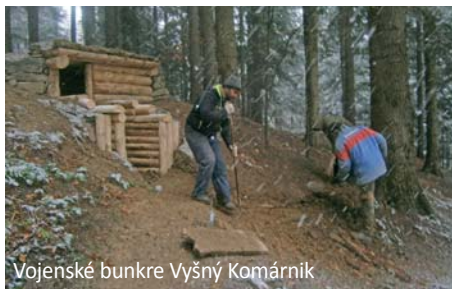
Vojenské bunkre Vyšný Komárnik