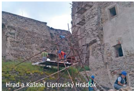
Hrad a Kaštieľ Liptovský Hrádok