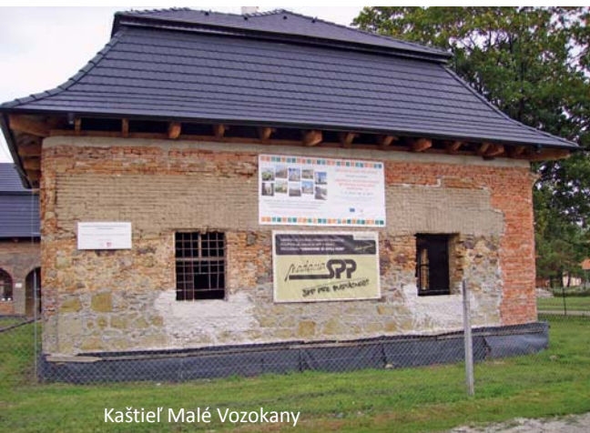
Kaštieľ Malé Vozokany

Zamestnanci vykonali tesárske a murárske práce pri dobudovaní krovu v arkádovej chodbe, domurovali zadnú štítovú stenu, opravili a zakonzervovali časti chýbajúcich stien. Vyhotovali šablóny pre klenby okien a s ich pomocou murovali a vytvárali otvory pre budúce okná. Opravili uvoľnenú izolačnú fóliu, vytriedili a vyviezli stavebnú sutinu. Opravili a vymenili poškodené oplatenie, pokosili areál kaštieľa a odstránili všetku náletovú zeleň.