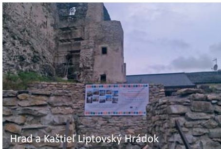
Hrad a Kaštieľ Liptovský Hrádok

Pomocní zamestnanci vykonávali: pomocné stavebné práce, pomocné práce pri stavbe podporných zariadení, čistenie areálu a vývoz odpadu, čistenie a triedenie sutiny, úpravu zelene a údržbu historických parkov, odstraňovanie prírodných a umelých prekážok v interiéri a exteriéri areálu a prístupových ciest, vykonávanie prác na základe pokynov zamestnávateľa.