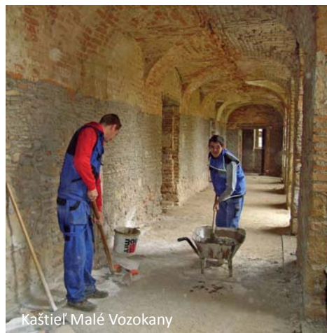
Kaštieľ Malé Vozokany