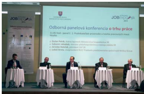
Panel č. 1: „Podnikateľské prostredie a tvorba pracovných miest“