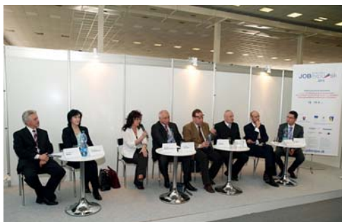
Workshop „Prepojenie škôl a trhu práce“