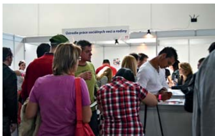
„ Veľtrh práce - Job Expo “

Z hľadiska pracovného uplatnenia bolo ďalším prínosom pre návštevníkov podujatia, že si mali možnosť overiť svoje jazykové, či počítačové zručnosti v testovacích miestnostiach a súčasne absolvovať test s akreditovaným certifikátom potvrdzujúcim ich úroveň schopností. Túto možnosť využilo približne 1 285 návštevníkov (z toho 385 návštevníkov - testovanie na voľbu povolania , 650 návštevníkov - testovanie na jazykové zručnosti , 200 návštevníkov - počítačových zručností , 50 návštevníkov - psychotesty , 100 návštevníkov - služby poradenstva pre osoby so zdravotným postihnutím ).