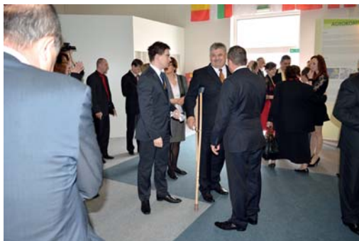
Podujatia sa zúčastnil aj prezident SR Ivan Gašparovič a minister práce, sociálnych vecí a rodiny SR Ján Richter.