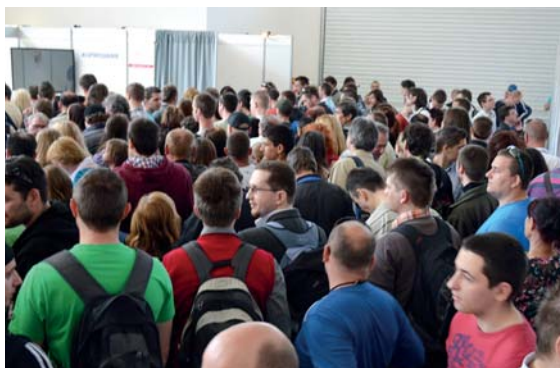
„Veľtrh práce - Job Expo“

Do projektu bolo k 31.1.2014 zapojených celkom 773 939 osôb cieľovej skupiny, z toho 417 167 mužov a 356 772 žien. Počet zapojených osôb cieľovej skupiny vysoko presiahol plánované hodnoty vzhľadom na rozsah poskytovaných služieb úradmi práce, sociálnych vecí a rodiny a vzhľadom na vysoký záujem o realizované veľtrhy práce.