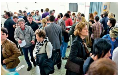
„Veľtrh práce - Job Expo“

„ Veľtrh práce - Job Expo “ je 2-dňová burza práce s celoslovenským zastúpením zamestnávateľov pre účastníkov z celého Slovenska realizovaná Ústredím práce, sociálnych vecí a rodiny (ďalej len „ústredie PSVR“).