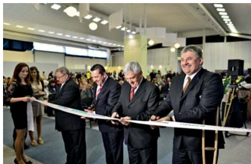
„Slávnostné otvorenie Veľtrhu práce - Job Expo 2013“

Návštevníci mali možnosť získať informácie o druhoch odbornej pomoci pri sprostredkovaní vhodného zamestnania, možnostiach vstupu na trh práce v SR a v zahraničí formou prednášok a prezentácií realizovaných v seminárnych miestnostiach.