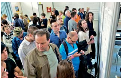
„Veľtrh práce - Job Expo“

Doposiaľ boli realizované 3. ročníky „ Veľtrhu práce - Job Expo “ a konali sa v priestoroch výstavniska Agrokomplex v Nitre, kde mali návštevníci možnosť osobne sa stretnúť so zamestnávateľmi z celého Slovenska a získať cenné rady súvisiace s hľadaním práce.