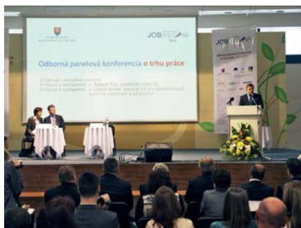
Konferencia o trhu práce za účasti predsedu vlády SR Roberta Fica