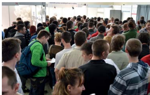
„Veľtrh práce - Job Expo“

Návštevníci mali možnosť získať informácie o druhoch odbornej pomoci pri sprostredkovaní vhodného zamestnania, aktuálnej situácii a možnostiach vstupu na trh práce v SR a v zahraničí formou prednášok a prezentácií realizovaných v seminárnych miestnostiach.