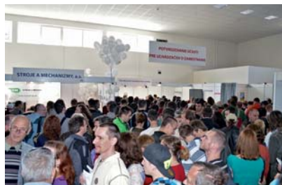
„ Veľtrh práce - Job Expo “

Práca má v živote človeka nezastupiteľné miesto, dáva mu pocit istoty, bezpečia, seberealizácie, ale i užitočnosti pre spoločnosť. Účasť na podujatí akým boli všetky ročníky „ Veľtrhu práce - Job Expo “ bola určite jednou z významných príležitostí, resp. zdrojom informácií ako prácu získať.