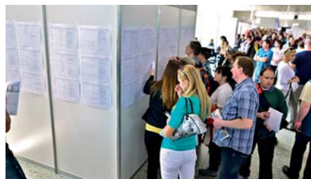
„ Veľtrh práce - Job Expo “