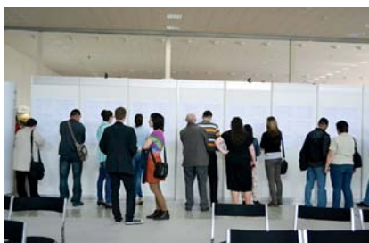
„Veľtrh práce - Job Expo“

Súčasne mali návštevníci možnosť otestovať si svoje jazykové a počítačové zručnosti alebo iné zručnosti. O testovanie jazykových zručností priamo na podujatí prejavilo záujem 570 osôb a viac ako 1 600 prejavilo záujem o on-line testovanie s možnosťou zaslania certifikátu. Testovanie počítačových zručností absolvovalo v priebehu podujatia celkom 280 osôb.