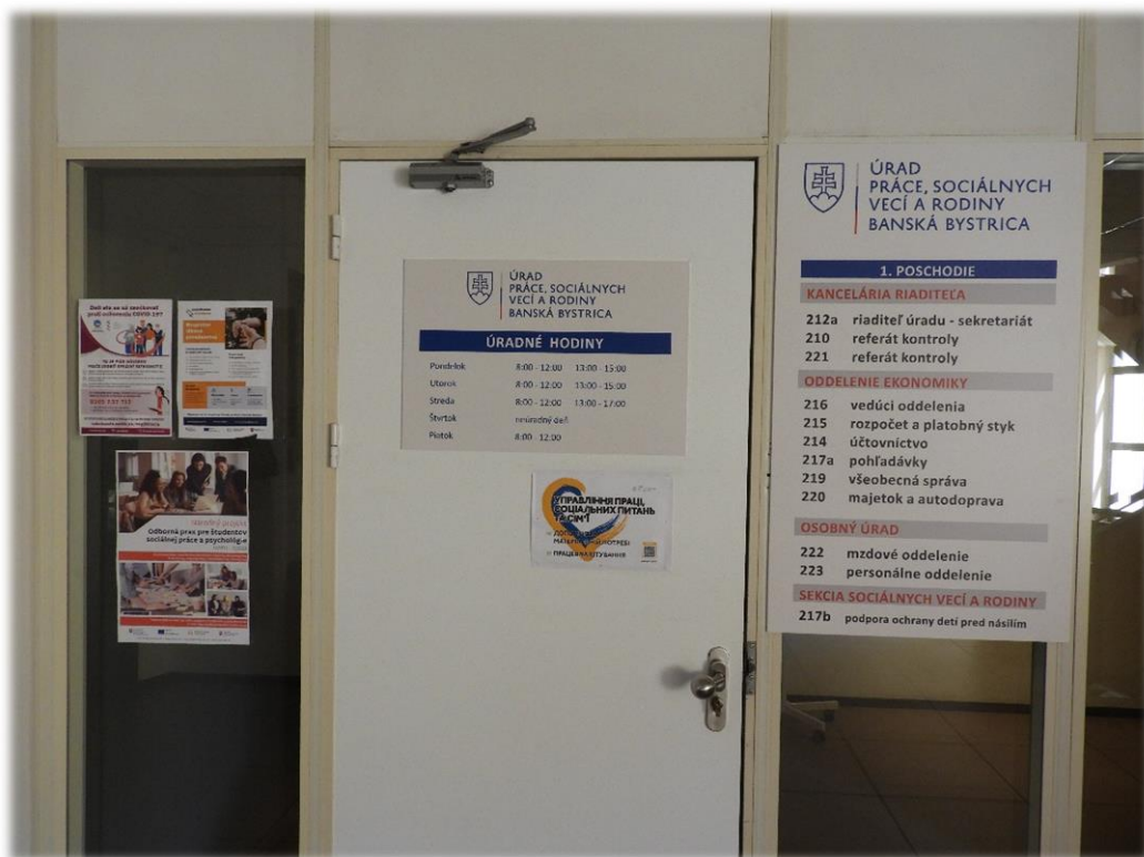
Obr. č.3: Umiestnenie plagátov formátu A3 – priestor kancelárie psychológa – kancelária č. 617