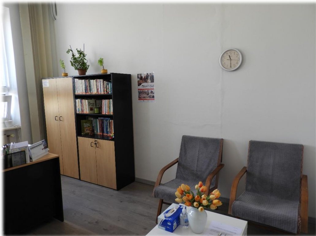
Obr. č.4: Umiestnenie plagátov formátu A3 – priestor kancelárie psychológa – kancelária č. 617 - detailnejší pohľad